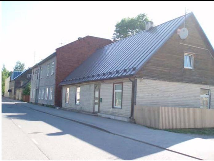
Vaade piki Kivi tänavat Jaama tänava poole (2-korruselised viilkatusega puitelamud)