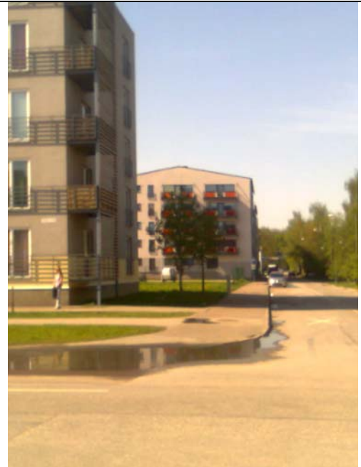
Vaade piki Kivi tänavat kesklinna poole (5-korruselised korterelamud)